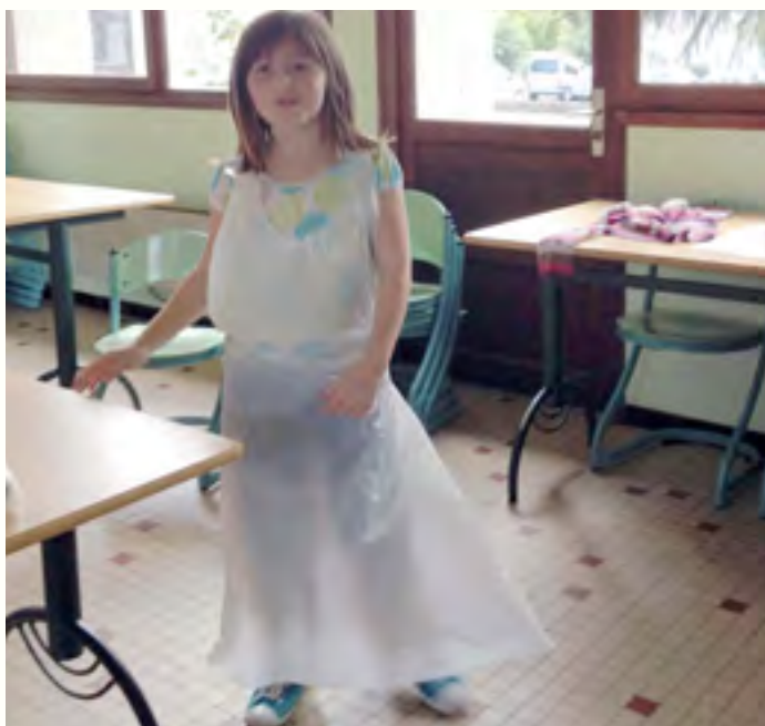
A la cuisine : avant de commencer, il faut se laver les mains et mettre un tablier.

Avec la machine à pop-cake on fabrique des boules toutes rondes. Pop-cake ça veut dire "sucette gâteau" en anglais (de lollipop = sucette et cake = gâteau).