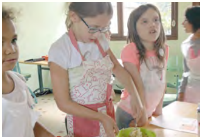
Les enfants suivent la recette