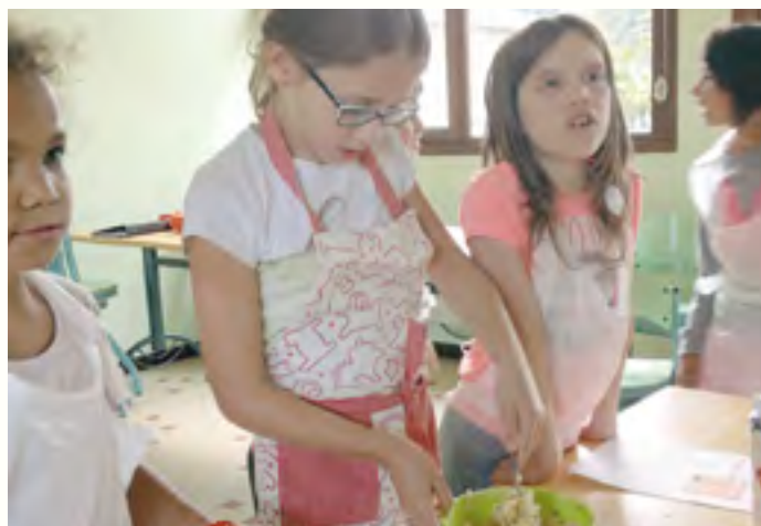
Les enfants suivent la recette

Depuis la rentrée, Kathy fait la cuisine aux enfants tous les jours après l'école. Elle a eu l'idée de faire la cuisine aux enfants de l'école parce qu'elle cuisine beaucoup et que les enfants aiment cuisiner aussi et manger ce qu'ils font. Tout le monde aime ça : on peut manger de la pâte toute seule sans rien et on peut goûter de tout ce qu'on a fait. Et certains sont très gourmands ! Les enfants s'installent à la cantine. Par exemple ils ont fait des pop-cakes. On peut les faire au chocolat et à la framboise. Pour faire les pop-cakes il faut une