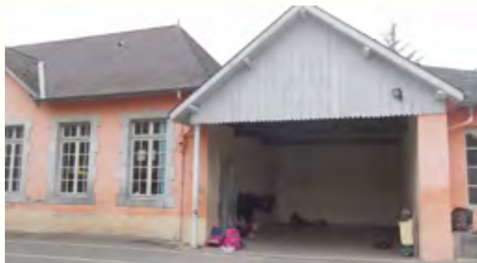
L'école actuelle : avant c'était l'école publique réservée aux filles

A vant à Lucq il y a eu jusqu'à 10 écoles. Le premier instituteur dont on se rappelle le nom s'appelait Jean de la Courrège, en 1463 ! Il y avait des écoles dans plusieurs quartiers : à Lucq Bielh (qui a fermé en 1845), Marquesouquère, Lamarquette, Parlayou, Bordes, Capdelayou. Certaines existaient déjà avant la révolution (1789). Il y a eu aussi un centre de formation technique à Capdelayou (de 1944 à 1952). Au bourg il y avait deux écoles : celle des garçons qui