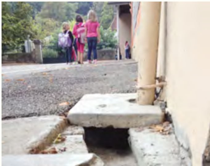
La mue de serpent était à côté du tuyau d'évacuation d'eau (photo E - P).