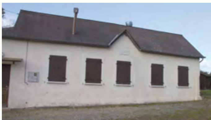
L'ancienne école de Marquesouquère (en haut) et la toute première école des filles (en bas).