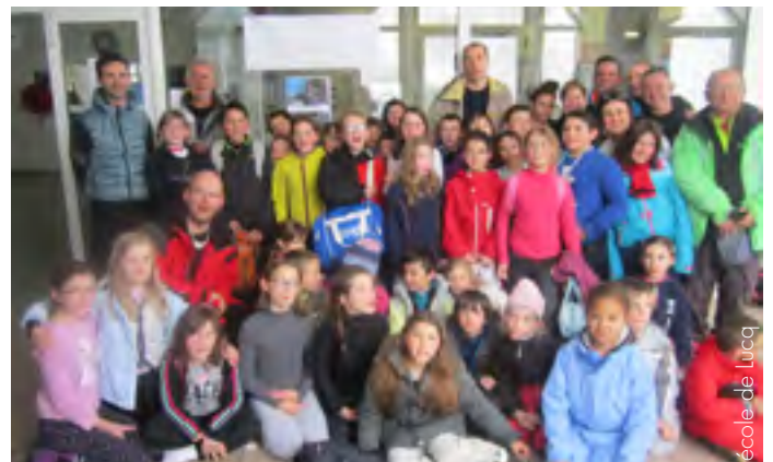
Les élèves à la sortie ski avec l'école de Parbayse.

La sortie Pelote : les enfants ont bien joué et ils ont rencontré d'autres personnes.