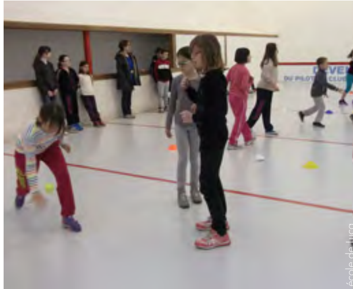
A la pelote le but est d'essayer de marquer trois points.

L'école de Saint Cricq s'est pas mal débrouillée. Tous les enfants