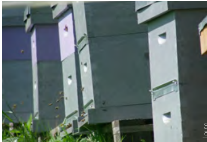
Au printemps les abeilles butinent à nouveau !