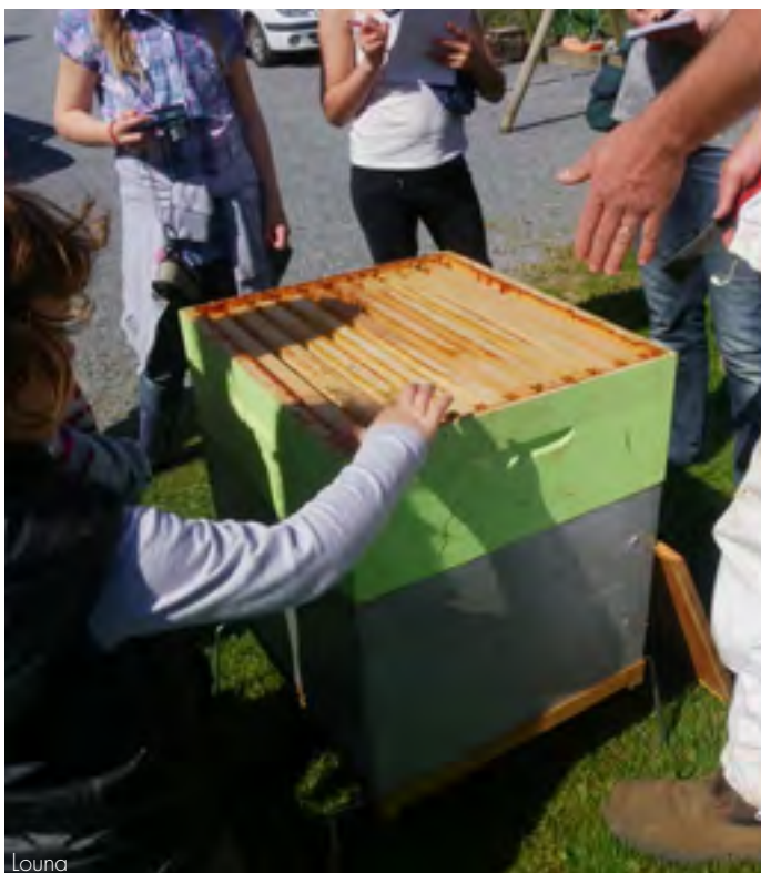
Le grenier à miel : dans cette partie (en vert), l'apiculteur récolte le miel fabriqué par les abeilles.

Une ruche est composée de deux parties. Celle du bas c'est le corps de la ruche qui contient les cadres remplis de cire et où la reine va pondre. Au dessus, une «hausse» que les abeilles vont remplir de miel. On l'appelle le grenier à miel. La reine n'y vient pas. C'est dans cette partie que l'apiculteur récolte le miel fabriqué par les abeilles.