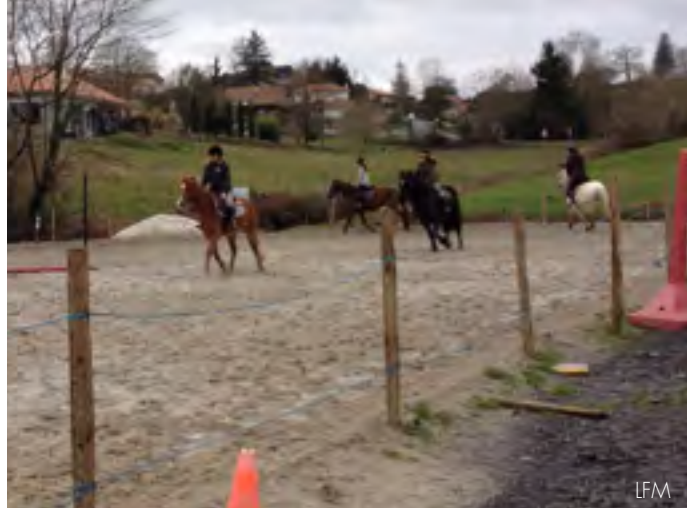
Au centre équestre de Lahourcade : Les chevaux sont adorables quand ils galopent.

Dans un centre équestre, il y a aussi la sellerie où l'on trouve tout le matériel pour monter sur